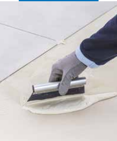
Aplikace Ultrabondu Eco 4 LVT a lepení LVT s širokými spárami a distančními křížky