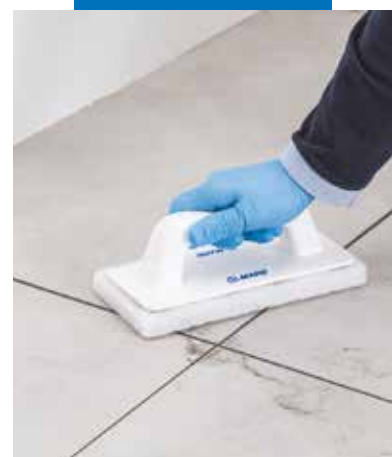
Odstraňování případných zbytků výrobku několik hodin po aplikaci abrazivní houbou Scotch-Brite®