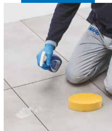
Konečné dočištění povrchu výrobkem Kerapoxy Cleaner