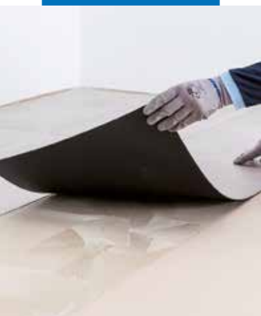
Lepení LVT s použitím Ultrabondu Eco 4 LVT