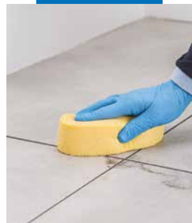
Odstraňování zbytků Flexcoloru 4 LVT z povrchu podlahy houbou