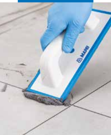
Výplň spár s použitím Flexcoloru 4 LVT