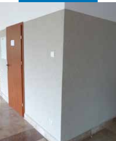
Ukázka použití výrobku Mape-Mosaic na stěně chodby