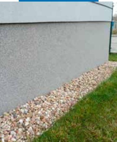
Ukázka aplikace výrobku Mape-Mosaic na fasádě

Podklad určený k aplikaci musí být soudržný, pevný, čistý a suchý, rovný, zbavený prachu, olejů, mastnot, barev a jiných vrstev s nedostatečnou přídržností. Staré omítky doporučujeme dobře umýt vodou. Čerstvé omítky nebo stěrky musí být zcela vyzrálé. Trhliny a praskliny vyrovnejte a opravte s použitím výrobků řady Mapetherm .