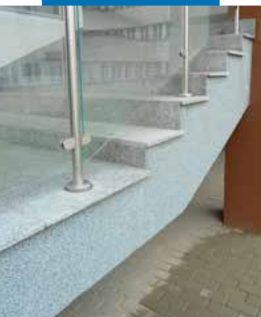
Estetická povrchová úprava boční strany schodiště s využitím výrobku Mape-Mosaic