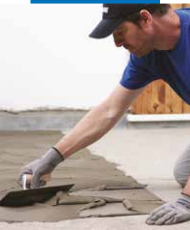
Aplikace lepidla zubovou stěrkou č. 5