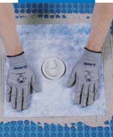
Hydroizolace podlahové vpustí s použitím Drain Vertical/Drain Lateral

Informace o tomto výrobku jsou k dispozici na požádání a na stránkách firmy MAPEI www.mapei.cz a www.mapei.com