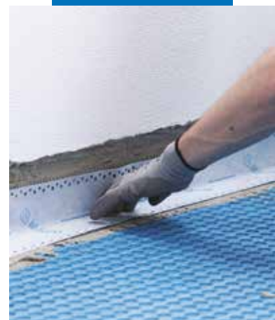
Obvodová hydroizolace páskou Mapeband Easy lepenou Mapeguardem WP Adhesive