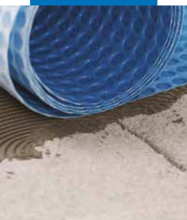
Instalace membrány Mapeguard UM 35