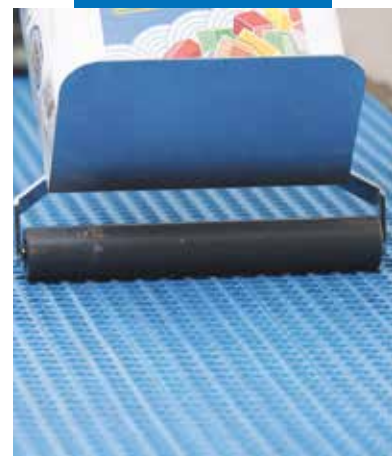
Přítlačení membrány Mapeguard UM 35