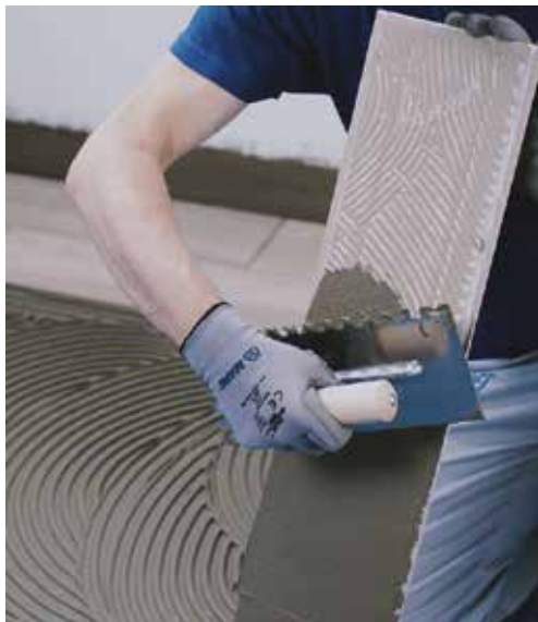
Lepení dlažby z keramiky nebo přírodního kamene vhodným lepidlem Mapei třídy nejméně C2

(1906/2007/ES – REACH) nevyžaduje přípravu Bezpečnostního listu. Při aplikaci doporučujeme používat ochranné rukavice a brýle a dodržovat bezpečnostní pokyny předepsané pro dané pracoviště.