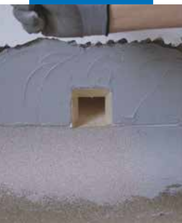
Hydroizolace odvodňovacího chrliče s použitím Drain Front