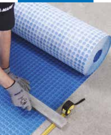
Řezání fólie Mapeguard UM 35