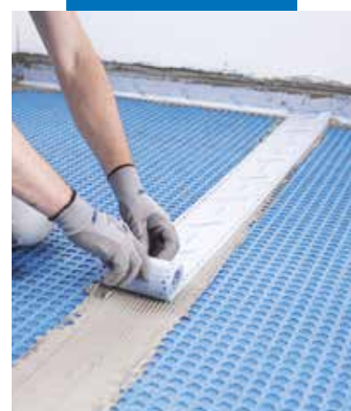
Hydroizolace spár mezi pásky s použitím Mapebandu Easy lepeného Mapeguardem WP Adhesive